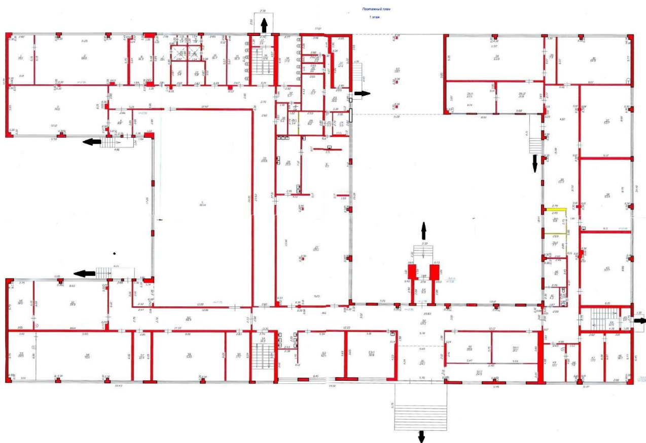
Схема выходов из здания школы и направление движения обучающихся, во время эвакуации при возникновении Чрезвычайной ситуации (ЧС)